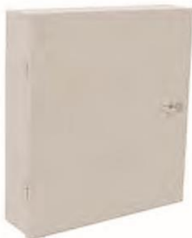
OP (05) B-48