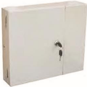
OP (05) C