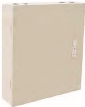
OP (05) A-24

Los gabinetes de montaje de pared proporcionan una solución sencilla para la implementación de sistemas de telecomunicaciones por fibra óptica de baja capacidad. Su diseño compacto permite su instalación en el interior de edificios y oficinas. Viene provisto de varios accesorios para evitar contingencia que pueda dañar las fibras en su interior.