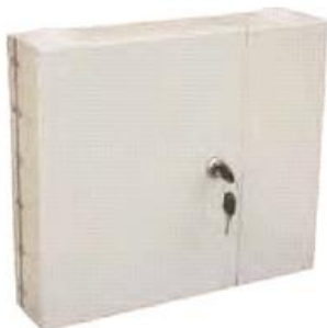
OP (05) D