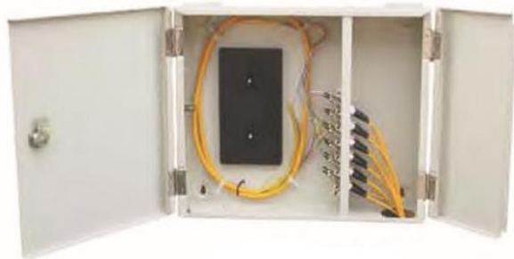
OP (05) C-FC12