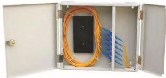
OP (05) C-SC12