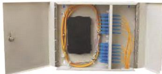
OP (05) D-SC24