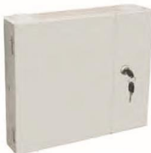
OP (05) B-48